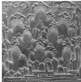
<백제 산수무늬 벽돌>